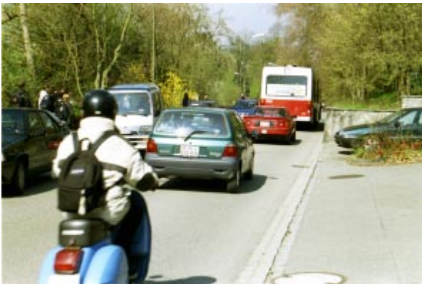
Der Verkehrslärm wird hauptsächlich durch die beiden Faktoren Verkehrsmenge und Geschwindigkeit bestimmt.

Wer immer sich in angrenzenden Grundstücken im Garten oder bei offenem Fenster im Gebäude aufhält, wird durch den Lärm zumindest stark irritiert. Fakt ist: Schallemissionen über 60dB werden gemäss zahlreichen Untersuchungen von einer Mehrheit als deutlich störend empfunden. Besonders gilt dies für den sehr unregelmässigen Verkehrslärm!